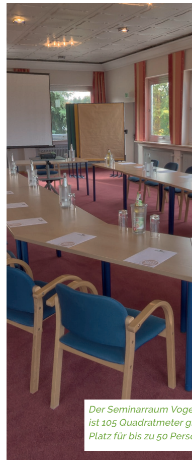
Der Seminarraum Vogelsberg ist 105 Quadratmeter groß. Hier ist Platz für bis zu 50 Personen.