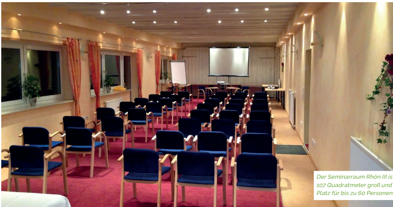
Der Seminarraum Rhön III ist 107 Quadratmeter groß und bietet Platz für bis zu 60 Personen.