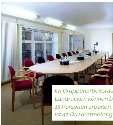
Im Gruppenarbeitsraum Landrücken können bis zu 15 Personen arbeiten. Er ist 42 Quadratmeter groß.