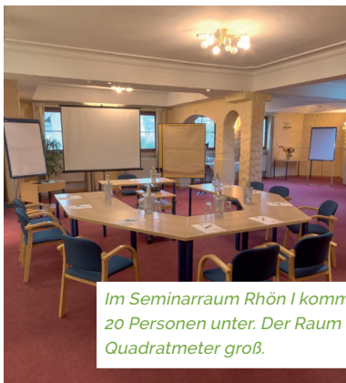
Im Seminarraum Rhön I kommen 20 Personen unter. Der Raum ist 75 Quadratmeter groß.